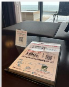
客室へのQRコード設置例

支払いに「ふるさと応援納税」が利用できることをお知らせする設置物は、すべて弊社でご用意します。