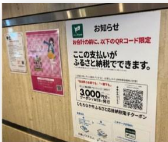
掲示板へのポスター掲示例