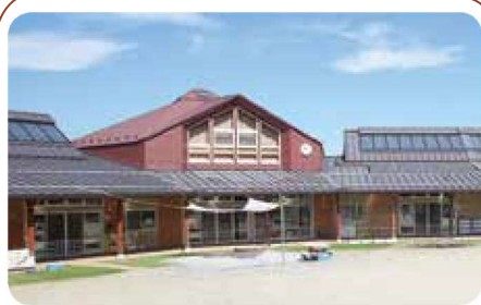
ながと保育園 長和町長久保 507-1

https://www.town.nagawa.nagano.jp/kosodate_kyoiku/hoiku_kodomo_yochien/1077.html