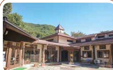
和田保育園 長和町和田 1792