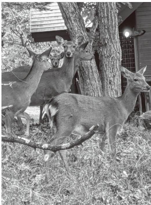
姫木平で遭遇したシカの群れ