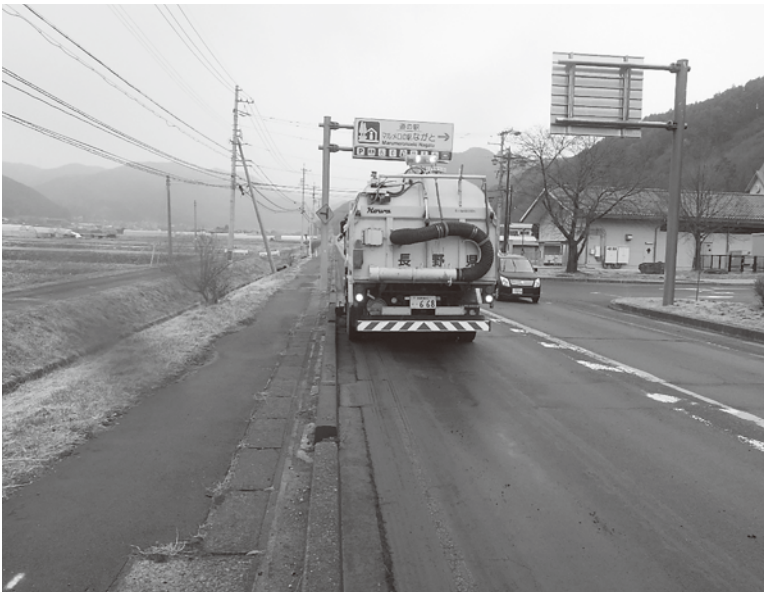
12月一般質問の際要望した国道、側溝の清掃

* 信州ふるさとの道ふれあい事業（アダプトシステム） 県管理道路を地域団体が“里親”となり、清掃・草刈りなどの美化活動を行う制度。県・市町村と協定を結び、地域で道路景観を守る仕組み。 団体への主な特典：県から清掃用具の貸与・広報支援、活動区間への団体名入り看板設置（社会的信用の向上）、地域貢献として企業CSR・学校教育に活用可能。