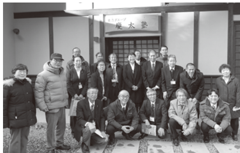
青木村・慶太塾にて

令和8年度一般会計・特別会計予算、令和7年度一般会計・特別会計補正予算、条例案2件他について審議が行われ、全ての議案