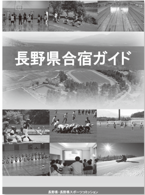
長野県が作成した『長野県合宿ガイド』

答 産業建設課長 従来掲載施設だった姫木平自然の家が返還され営業休止のため。今後は宿泊施設への意向確認や調査を行い、掲載を目指す。今後の受入体制整備は