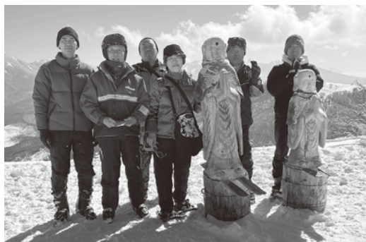
スキー地蔵前にて

この交流会がきっかけで下諏訪町の小学生のスキー教室が開催されるようになりました。下諏訪町との親睦が深まり、下諏訪町の下諏訪町議会議長はじめ、4名、長和町議会からも8名参加し、好天に恵まれ最高のコンディションの中、情報交換グループとスキー