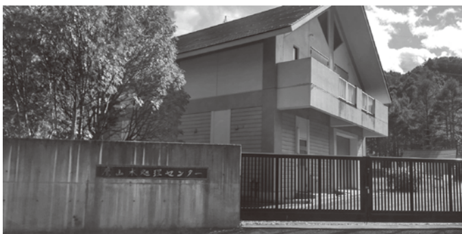
鷹山水処理センター