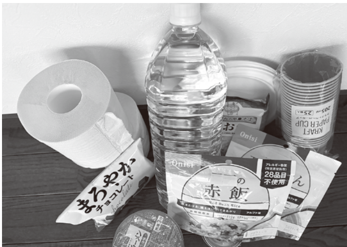
家庭で準備できる防災備蓄品の一例。日持ちする食品、水、トイレットペーパーなど

答 総務課長事務取扱 長野県の防災における重点項目のひとつとして避難生活の質の改善を図